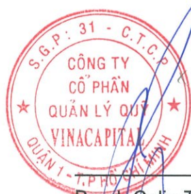
Brook Colin Taylor Chủ tịch Ngày 14 tháng 8 năm 2017

Các thuyết minh từ trang 11 đến trang 32 là một phần cấu thành các báo cáo tài chính này.