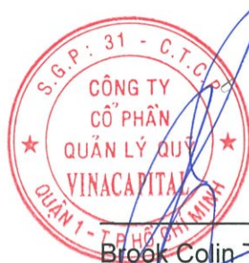
Brook Colin Taylor Chủ tịch Ngày 14 tháng 8 năm 2017